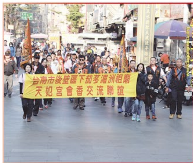
台南市淵淵祖廟天妃宮