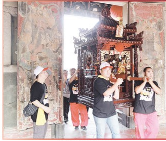
新北市玄德會進香團