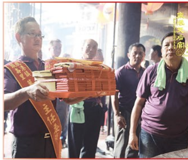
鹿港鎮頭高里萬興宮