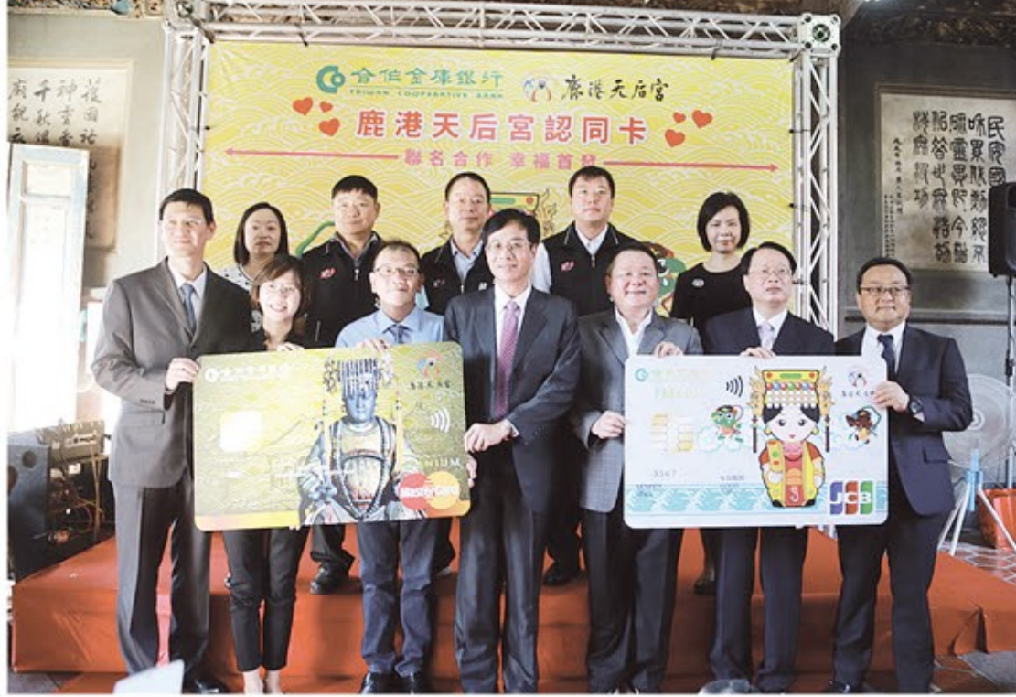
天后宮與合作金庫合作的鹿港天后宮淵淵媽祖金身的萬事達卡欽金悠遊認同卡，及Q版媽祖JCB晶緻一卡通認同卡，號召信眾一起來行善。

其他還有高額回饋現金無上限，機場貴賓室服務、國際機場停車、24小時道路救援、市區停車、高爾夫平安險、高鐵升等商務車廂等優惠，在一般信用卡福利越來越縮水的現今，鹿港天后宮與合作金庫聯合推出鹿港天后宮認同卡，幫卡友把優惠都找回來，並完成大家隨時消費都可以做公益的善心願景，詳細資訊可上：鹿港天后宮官網 http://www.lugangmazu.org/ 、合作金庫銀行網站 http://www.tcb-bank.com.tw 或合庫全臺各營業單位查詢。