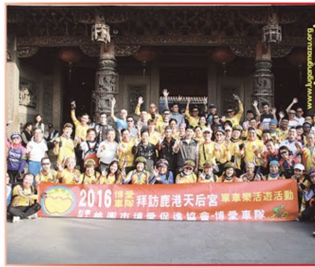
桃園市博愛促進協會博愛車隊暨蒞臨本宮參香拜訪