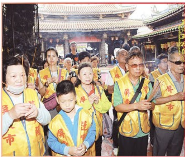
屏東縣蓮寶殿進香團