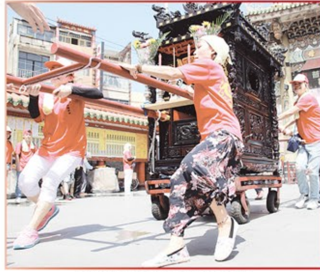
新北市仁愛侯邑祖城隍爺進香團