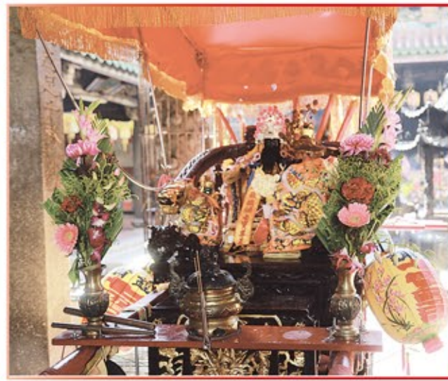
彰化縣鐵鋪七寶尊王進香團